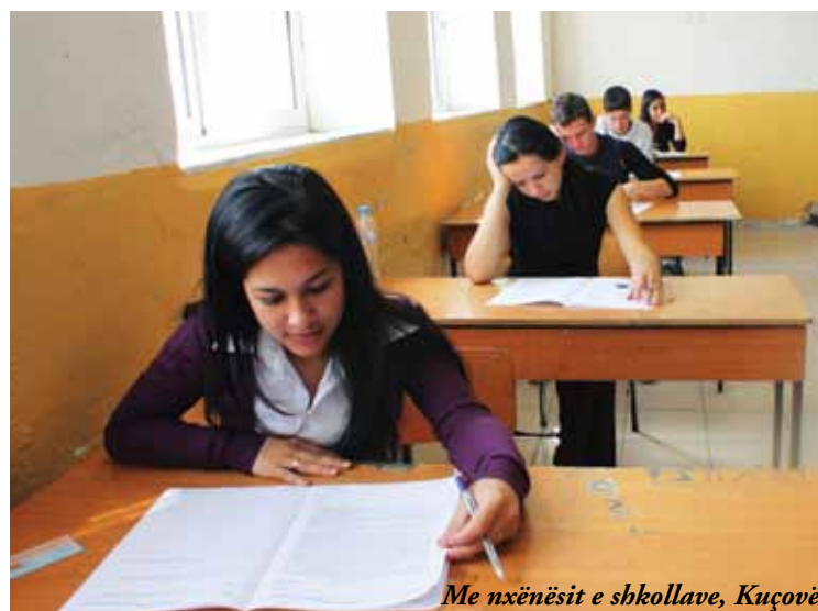
Me nxënësit e shkollave, Kuçovë

Ky sukses nuk do të arrihej pa përkushtimin e punën e palodhur, pasionin, mundin dhe përpjekjet e vazhdueshme të mësueses së lëndës së vendlindjes e cila gjatë gjithë punës së saj një- vjeçare e finalizoi në një shkallë maksimale këtë lëndë, nëpërmjet këtij projekti që do të mbetet në kujtesën e gjithsecilit. Urimet më të mira për këtë projekt mësuesve dhe nxënësve të klasave të pesta të shkollës “28 Nëntori” Kuçovë.