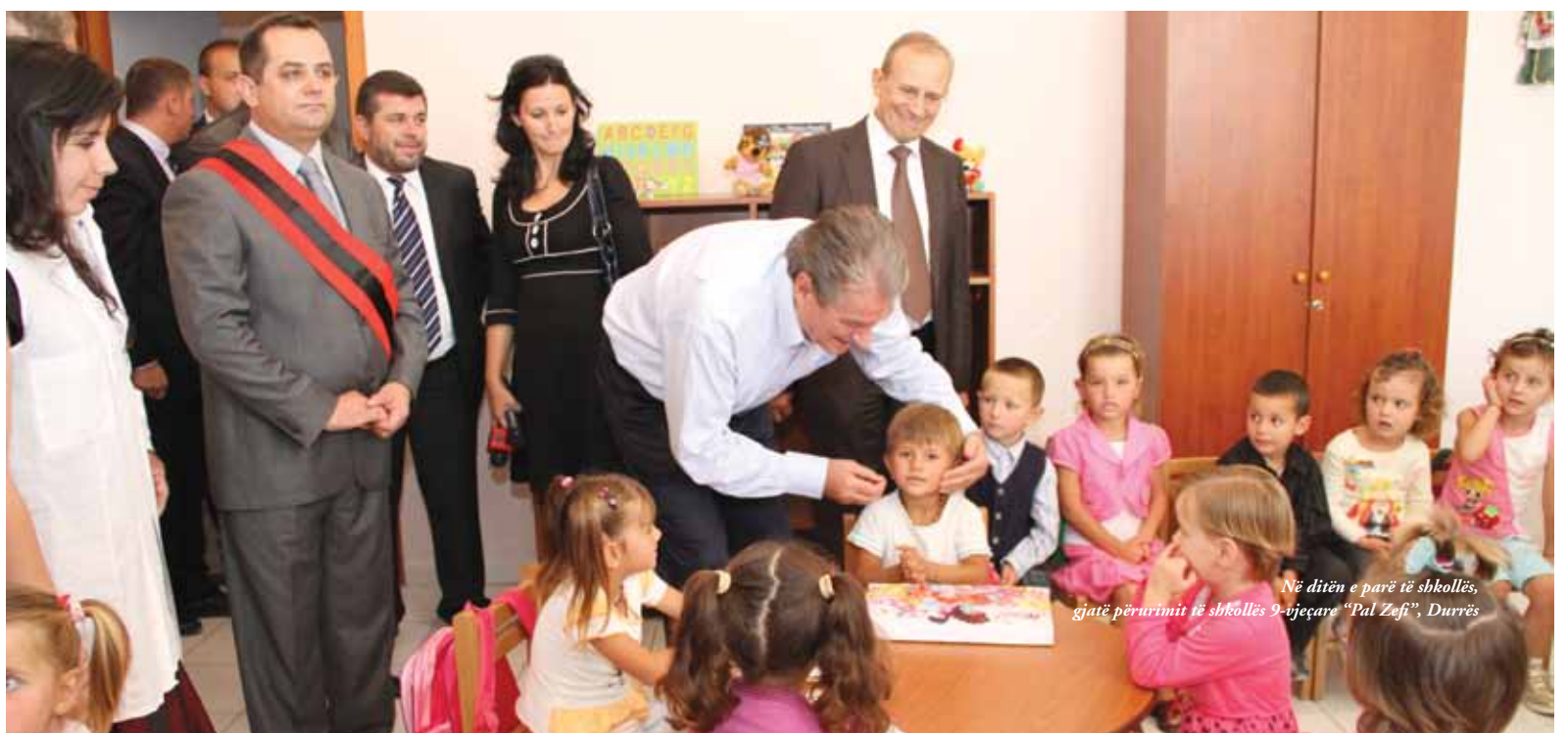
Në ditën e parë të shkollës, gjatë përrurimit të shkollës 9-vjeçare “Pal Zefi”, Durrës

Ndër shumë strategji që janë duke u zbatuar në vende të ndryshme të botës, e njohur është ajo e Menaxhimit në Bazë Shkolle. Thelbi i saj konsiston në decentralizimin e vendimmarrjes në arsim, nëpërmjet rritjes së përfshirjes së prindërve dhe të komunitetit në veprimtarinë e shkollave.