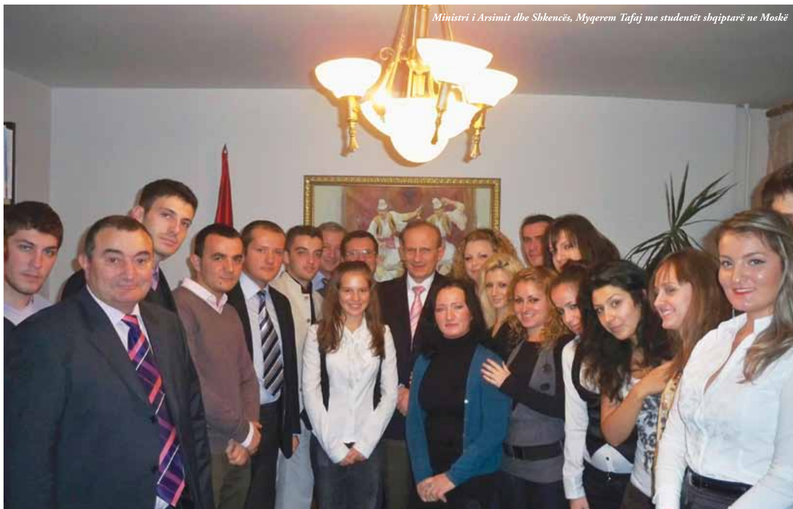
Ministri i Arsimit dhe Shkencës, Myqerem Tafaj me studentët shqiptarë në Moskë

Ministri i Arsimit dhe i Shkencës, z. Tafaj, pati takime të shumta me homologë të tij, me Drejtoren e Përgjithshme të UNESCO, Znj. Irina Bokova dhe me përfaqësues të organizatave që ndihmojnë në fushën e arsimit. Ministri Tafaj u ftua nga shumë homologë për të vizituar vendet e tyre me qëllim shkëmbimin e përvojave në fushën e arsimit.