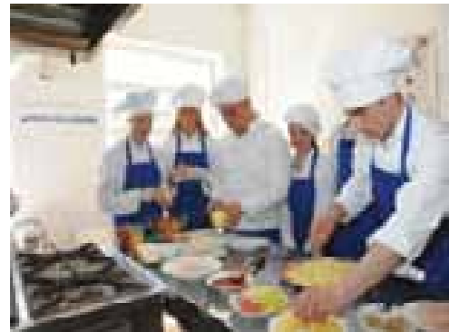
Nxënësit e Hoteleri -Turizëm

Shkolla e mesme teknike- ekonomike "ISUF GJATA" në Korçë, është një shkollë e mesme profesionale me katër drejtime: ekonomi-biznes, hoteleri-turizëm, teknologji ushqimore, tekstil konfeksion. Në përfundim të kësaj shkolle, nxënësi përgatitet me aftësi profesionale në një nga drejtimet si: kamerier, recepsionist, shërbime hotelerie, ekonomist i mesëm, shërbime zyre, punëtor ndihmës në procese teknologjike të përpunimit të mishit dhe miellit, rrobaqepës, ndihmës kuzhinier etj.