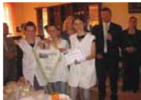
Fituesit e Flamurit

Nga viti 2005 ne kemi punuar për t'i dhënë shkollës emrin e vërtetë të një shkolle profesionale. Në shtator 2005 shkolla kishte vetëm një kabinet informatike me 23 kompjuterë, prej të cilëve 15 të financuar nga MASH dhe të tjerët nga një bashkëpunim i bashkisë Korçë me fondacionin TABITA, si dhe një repart rrobaqepësie për zhvillimin e praktikave profesionale të drejtimit, Konfeksion, i cili u financua po nga fondacioni TABITA. Pra, shkollës i mungonin repartet e praktikave profesionale për të gjitha drejtimet e shkollimit që ofronte. Gjatë këtyre viteve kemi punuar për të përmirësuar kushtet e shkollimit duke ju afruar hap pas hapi shkollave më me përvojë në Shqipëri të të njëjtit profil me shkollën tonë, por dhe standardeve bashkëkohore të shkollimit. Jemi mbështetur në punën tonë nga DAR Korçë, pushteti vendor, bordi i prindërve të shkollës, prindërit dhe nxënësit, drejtorja e Bujqësisë dhe Ushqimit, Korçë etj, por mbështetësi dhe financuesi kryesor ka qenë fondacioni TABITA, këtu në Korçë. Me ndihmën e tyre u bë